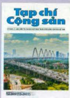
Bìa 1: Cầu Nhật Tân - một trong những cây cầu huyết mạch của Thủ đô Hà Nội