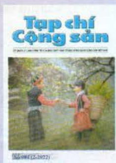
Bìa 1: Vui đón xuân về