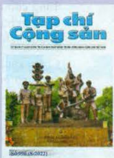
Bìa 1: Tượng đài “Công an nhân dân vì dân phục vụ”