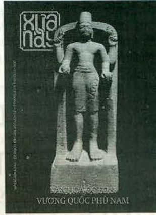
Ảnh bìa 1: Tượng thần Vishnu đá, thế kỷ VII-VIII. Hiện vật trưng bày tại Bảo tàng Lịch sử Quốc gia Việt Nam