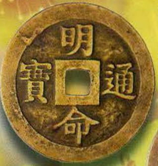
Bìa 1: Tiền Minh Mệnh thông bảo, mặt lưng: "Quốc thái dân an, Phong điều vũ thuận"