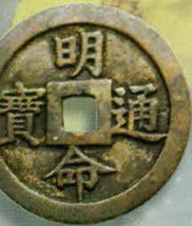
Bìa 1: Tiền Minh Mệnh thông bảo, mặt lưng: "Phúc như đông hải, thọ ti nam sơn"