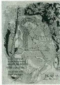
Ảnh bìa 1:

"Khi tình rượu, lúc tàn canh Giật mình, mình lại thương mình xót xa" (Họa sĩ Nguyễn Gia Trí).