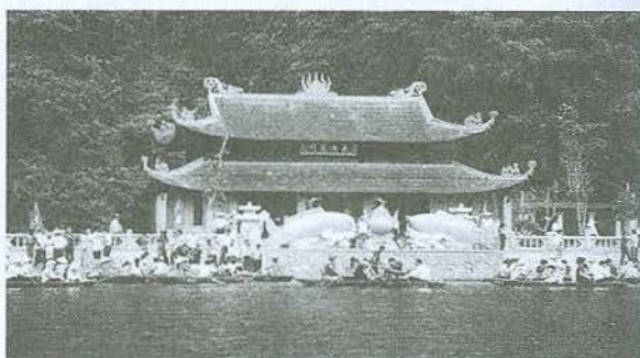
Đền Trinh – Ngôi đền linh thiêng ở Tràng An, Ninh Bình