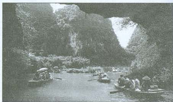
Văn cảnh Tràng An trên những con thuyền nhỏ mang đến cảm giác thư thái cho du khách