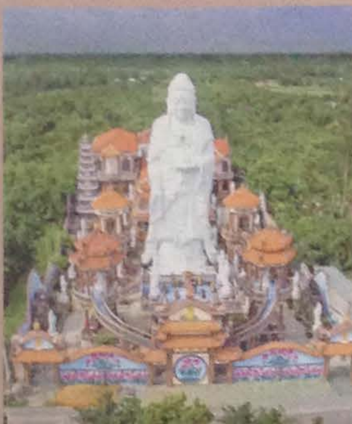
Tượng phật uy nghi tại chùa Phước Thành

Cách đó không xa, hồ Ô Thum dưới núi Phụng Hoàng (xã Ô Lâm) có khung cảnh đẹp, nằm sâu dưới triền núi, vô tình tạo không gian lý tưởng thu hút những người yêu thích thiên nhiên và bạn trẻ khám phá, chụp ảnh. Đến đây, du khách thích thú thưởng thức món ăn trứ danh, độc đáo: gà đốt Ô Thum.