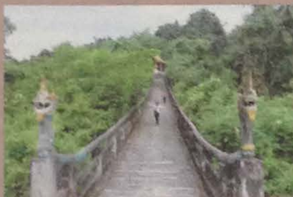
Huyền bí đường lên chùa Tà Pạ