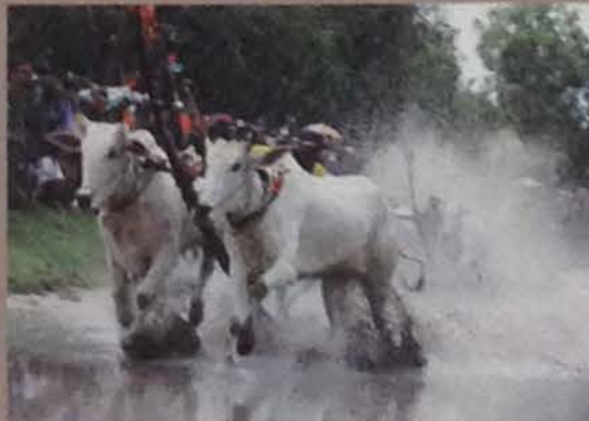
Độc đáo đưa bò Bảy Núi ở An Giang