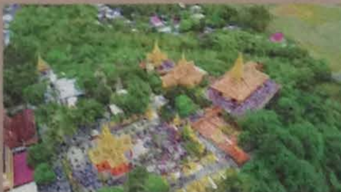
Chùa Tà Pạ như lơ lửng trên không