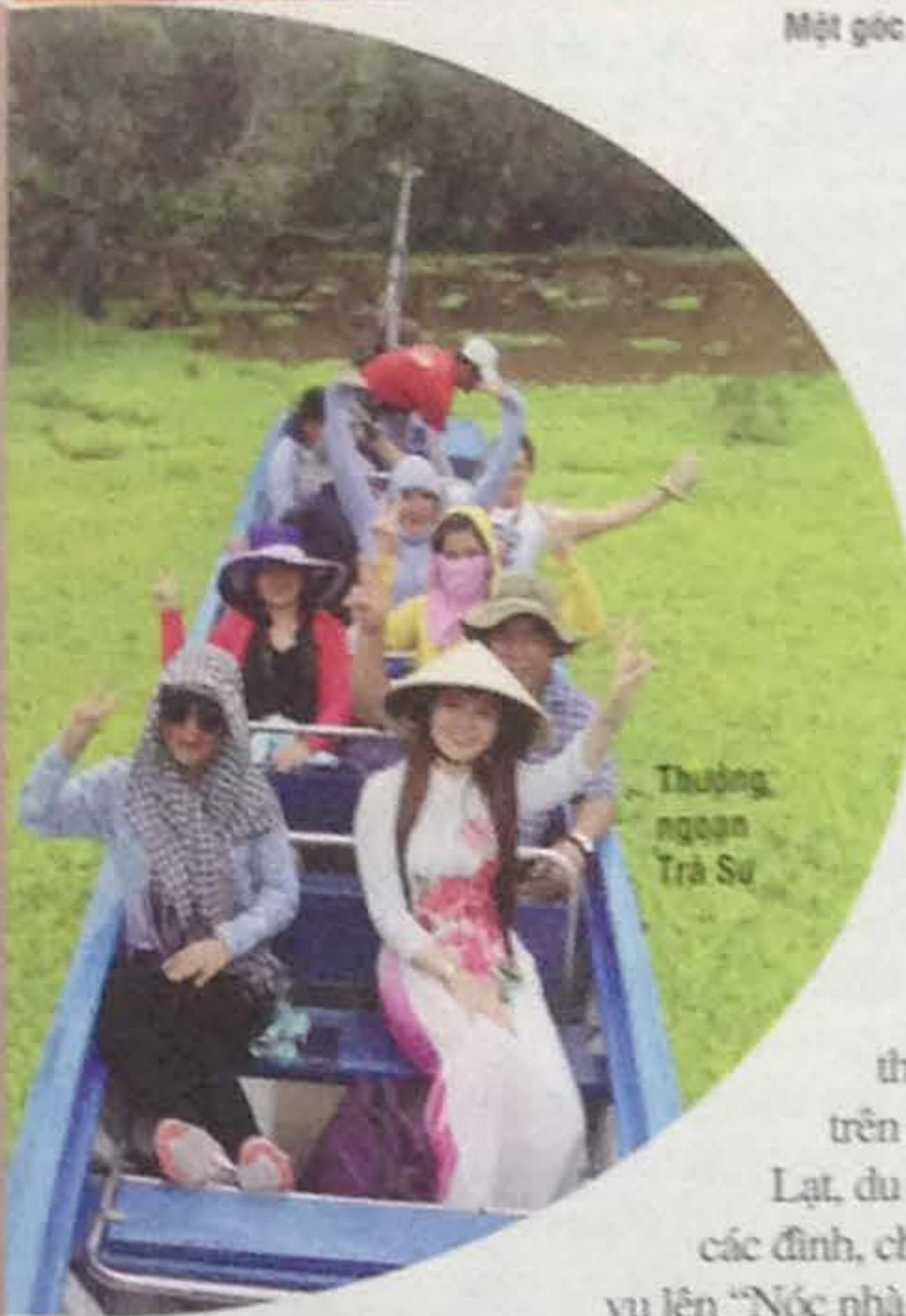
Thượng ngàn Trà Sư

Rời Tri Tôn, du khách đến núi Cẩm- “Nóc nhà miền Tây”, thuộc dãy Thất Sơn huyền thoại, được ví như chốn bồng lai tiên cảnh. Nhiều du khách lựa chọn thưởng thức thời tiết trên núi se lạnh như Đà Lạt, du xuân và cúng viếng các đình, chùa ở đỉnh núi. Ví dụ lên “Nóc nhà miền Tây”- núi