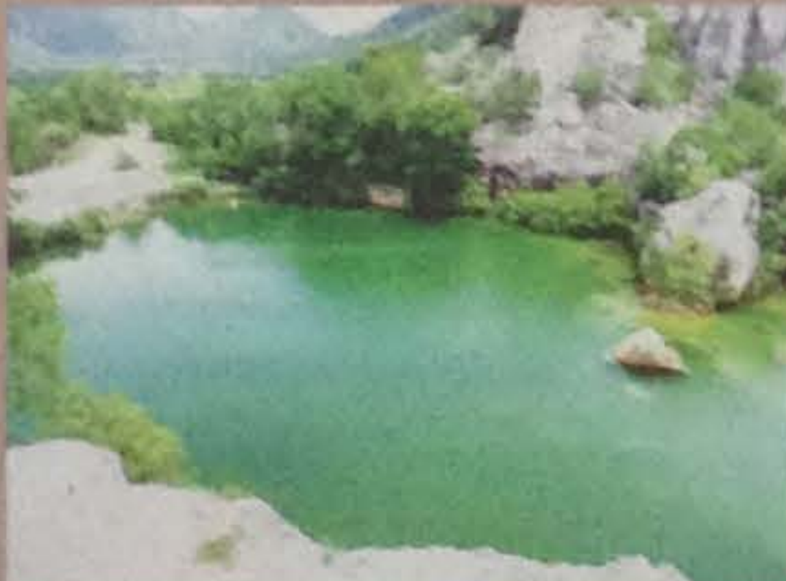
Hồ Tà Pạ