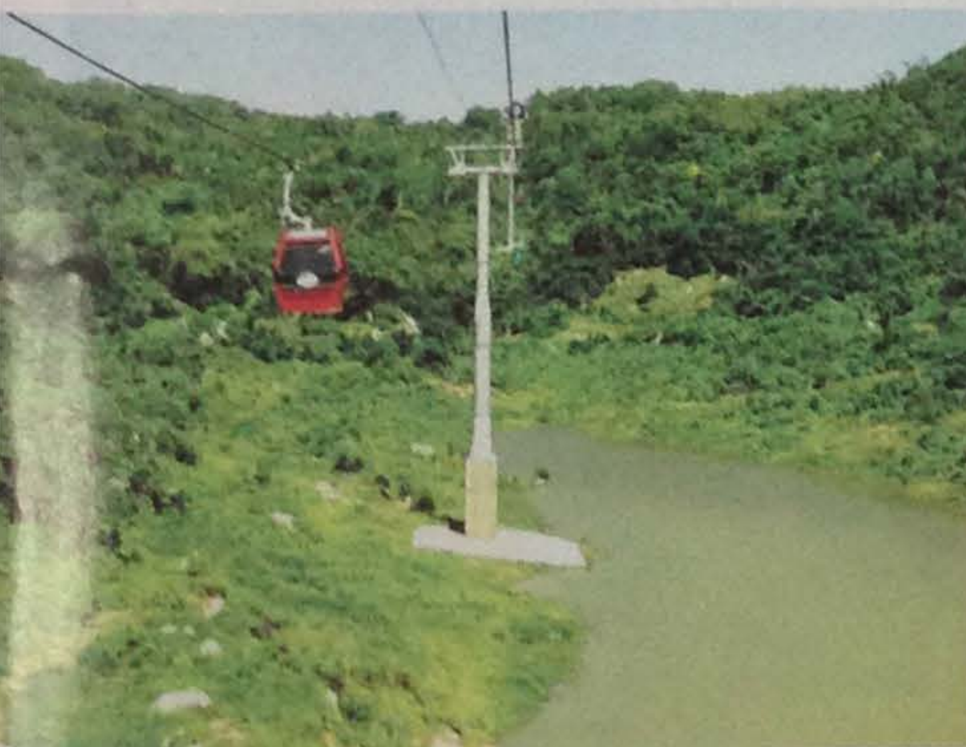
Cáp treo Núi Cẩm