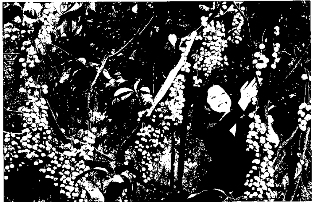
Vườn Xăng mang nét đẹp đặc trưng của người miền Tây.

VỚI ĐẶC THÙ ĐÔ THỊ SINH THÁI, SÔNG NƯỚC, THÀNH PHỐ CẦN THƠ CÓ NHIỀU TIỀM NĂNG PHÁT TRIỂN DU LỊCH NÔNG NGHIỆP (DLNN). THỜI GIAN QUA, DLNN ĐÃ CÓ SỰ PHÁT TRIỂN MẠNH MẼ VÀ ĐÓNG GÓP KHÔNG NHỎ VÀO TỔNG DOANH THU CỦA NGÀNH DU LỊCH THÀNH PHỐ. VIỆC QUY HOẠCH, PHÁT TRIỂN DLNN MỘT CÁCH BÀI BẢN, BỀN VỮNG ĐƯỢC LÃNH ĐẠO THÀNH PHỐ CẦN THƠ VÀ NGÀNH CHỨC NĂNG QUAN TÂM, VỚI MONG MUỐN VỪA GÓP PHẦN PHÁT TRIỂN DU LỊCH VỪA QUẢNG BÁ NÉT ĐẸP VĂN HÓA ĐẶC TRƯNG CỦA CẦN THƠ ĐẾN VỚI DU KHÁCH TRONG VÀ NGOÀI NƯỚC.