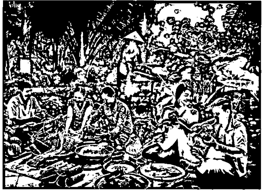
Cùng vui gói bánh tét.

Để hoàn thành mục tiêu, Cần Thơ đã xây dựng Kế hoạch phát triển thương hiệu du lịch nông nghiệp thành phố Cần Thơ; đào tạo bồi dưỡng đội ngũ hướng dẫn viên chuyên nghiệp, có kiến thức sâu rộng về văn hóa bản địa, về nông nghiệp và có khả năng thuyết minh nhiều thứ tiếng; tập huấn nâng cao kỹ năng tổ chức, vận hành, quản lý và phát triển mô hình vườn du lịch nông nghiệp bền vững cho chủ nhà vườn và người lao động. Đồng thời, tập trung xây dựng các mô hình vườn du lịch nông nghiệp kiểu mẫu phục vụ khách tham quan và lưu trú, trong đó chú trọng khai thác chiều sâu văn hóa của nền nông nghiệp bản địa đặc thù, đáp ứng tiêu chí phát triển bền vững, phù hợp với xu hướng phát triển đô thị sinh thái của thành phố; thiết kế tour, tuyến, cụm du lịch kết