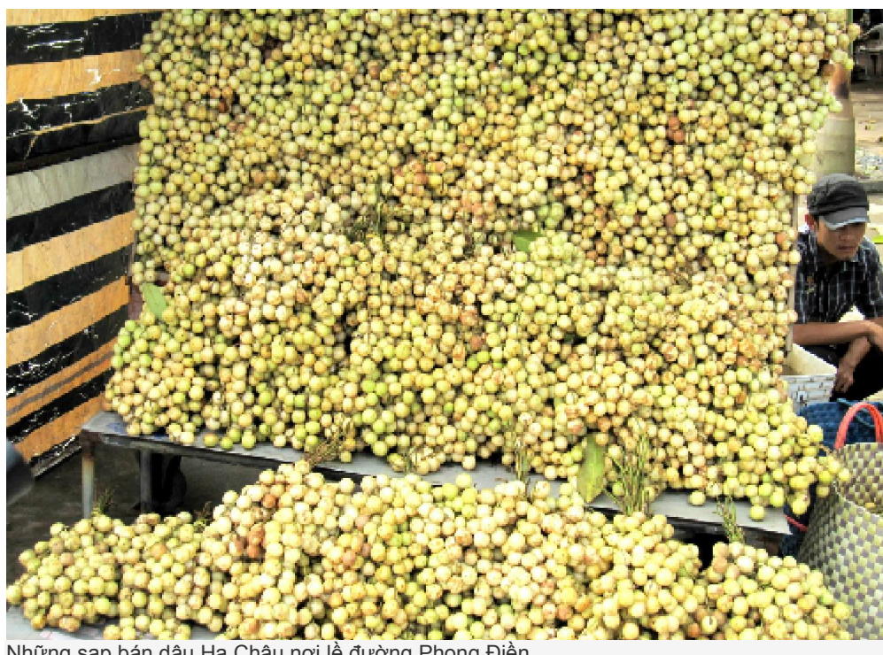
Những sạp bán dâu Hạ Châu nơi lễ đường Phong Điền.

Tuy xuất hiện muộn hơn các loại trái cây khác ở đây như: dâu bòn bon, dâu da xanh (dâu bà mụ), dâu xiêm, chôm chôm..., nhưng với những ưu điểm vượt trội về hình dáng, màu sắc và chất lượng, dâu Hạ Châu rất được ưa chuộng và đã làm nên thương hiệu cho vùng đất Phong Điền.