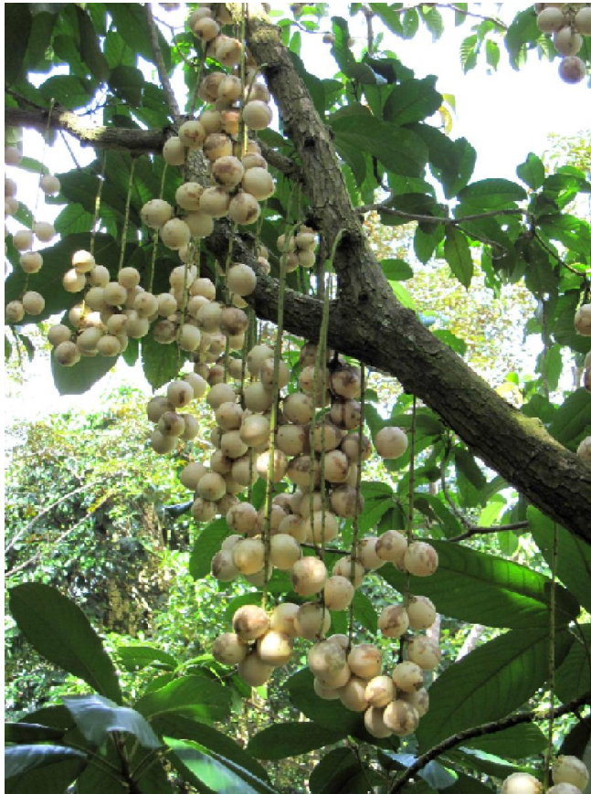
Những chùm dâu Hạ Châu lúc lỉu trên cành.