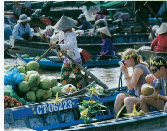
Du khách khám phá chợ nổi.

Thành phố Cần Thơ phấn đấu từ năm 2016 - 2020 đón 32 triệu lượt khách tham quan (trong đó có 3,5 triệu lượt khách quốc tế), tăng trung bình 10%/năm; đón 10,459 triệu lượt khách lưu trú (trong đó có 1,76 triệu lượt khách quốc tế), tăng trung bình 10%/năm; tổng thu từ du lịch đạt 12.100 tỷ đồng (tăng trung bình 16%/năm).