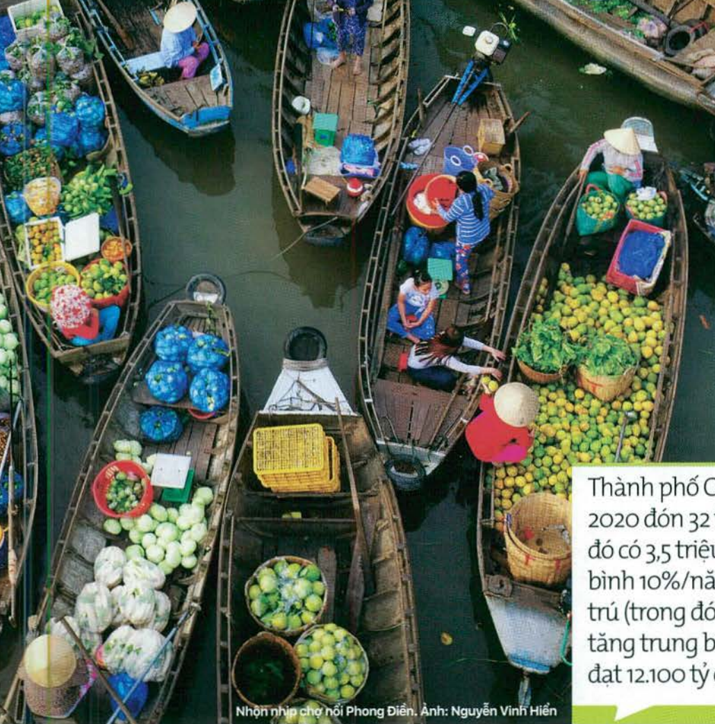
Nhộn nhịp chợ nổi Phong Điền.