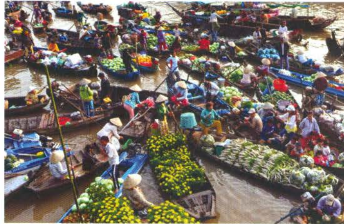
Chợ nổi Phong Điền

Thứ hai, nhà vườn làm du lịch chưa mạnh dạn đầu tư và phát triển phong cảnh vườn sinh thái. Thực trạng hoạt động du lịch tại Phong Điền cho thấy, một số hộ kinh doanh dịch vụ du lịch sinh thái vẫn còn “duy trì” nhiều cây tạp, cảnh quan không được chăm chút, trái cây trong vườn đơn điệu, thiếu đa dạng. Bố trí không gian trong vườn chưa khoa