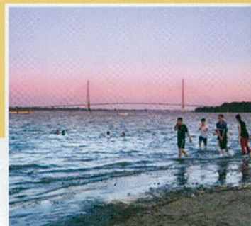
Biển Cần Thơ