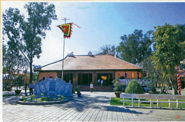
Dinh thần Tân An