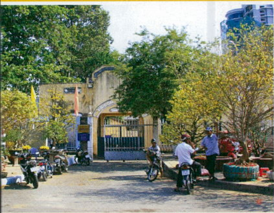
Khu di tích Khám lớn