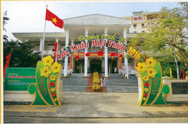
Bảo tàng thành phố