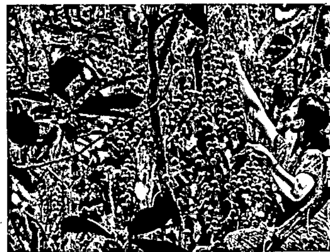
Du lịch miệt vườn mùa quả chín.

Nằm ở vị trí trung tâm đồng bằng sông Cửu Long, Cần Thơ có điều kiện tự nhiên phong phú với đất đai phì nhiêu, màu mỡ, hệ thống kênh rạch chằng chịt rất thuận lợi cho phát triển du lịch, thu hút sự quan tâm của du khách với các loại hình du lịch hấp dẫn như du lịch sinh thái, miệt vườn và du lịch sông nước.