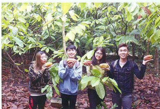
Vườn cao Mùời Cương (Phong Điền) thu hút nhiều du khách đến tham quan và thưởng thức cao cao.

Hiện nay, ngành du lịch thành phố đang tập trung nâng chất các sản phẩm du lịch, đẩy nhanh tiến độ thực hiện các hạng mục đề án “Bảo tồn và phát triển Chợ nổi Cái Răng” và bàn giải pháp nâng cao chất lượng sản phẩm du lịch của quận Cái Răng; cùng huyện Phong Điền xây dựng kế hoạch bảo tồn, phát huy chợ nổi Phong Điền; phối hợp quận Ô Môn xây dựng sản phẩm du lịch tại chùa Pôthisômôn; cùng Thốt Nốt thực hiện bảng chỉ dẫn điểm du lịch vườn cò Bằng Lăng; hỗ trợ nâng chất hệ thống các điểm đến du lịch tiêu biểu thành phố và ĐBSCL; thí điểm và xây dựng nhiều mô hình, sản phẩm mới: nông nghiệp đô thị gắn với du lịch (Bình Thủy), biểu diễn đàn guitar và nghệ thuật viết thư pháp (nghệ thuật đường phố) khu vực Bến Ninh Kiều... Đồng thời, tham mưu UBND phê duyệt danh mục 8 dự án mời gọi đầu tư lĩnh vực du lịch: Dự án khu du lịch cồn Sơn, Dự án du lịch sinh thái cù lao Tân Lộc, Dự án Khu đô thị du lịch sinh thái Phong Điền, Khu du lịch sông Hậu, Khu nhạc nước và dịch vụ đa chức năng thuộc Trung tâm Văn hóa Tây Đô, Khu vui chơi giải trí Cần Thơ, các hạng mục xã hội hóa thuộc đề án “Bảo tồn và phát triển Chợ nổi Cái Răng” ■