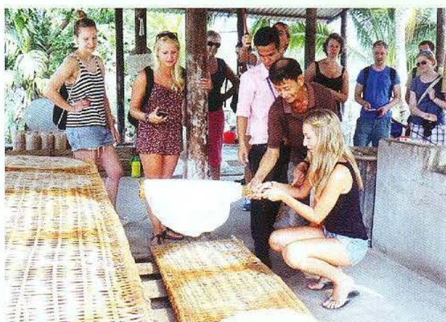
Khách du lịch trải nghiệm làm bánh tại cơ sở hút tẩu Sáu Hoài.