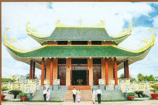
Du khách tham quan Khu tưởng niệm Thủ khoa Bùi Hữu Nghĩa.