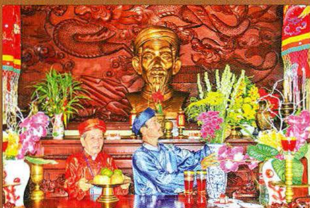
Kính nhớ tiên nhân!