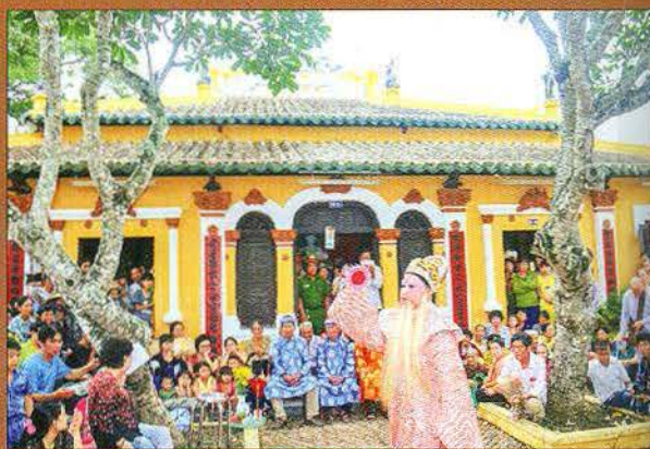
Đình Bình Thủy rộn ràng mùa lễ hội.