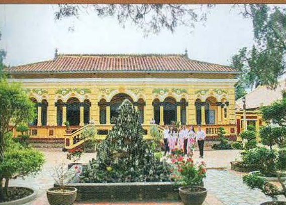
Nét đẹp Nam Nha Đường.