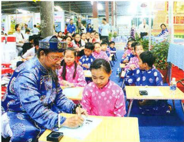
Nghệ nhân hướng dẫn thiếu nhi viết thư pháp tại Ngày hội Du lịch Chợ nổi Cái Răng 2018

bày phương tiện giao thông thủy ở Nam bộ: ghe hầu, ghe chài, ghe cui, xuồng ba lá, tam bản tại Chợ nổi Cái Răng, kết hợp trưng bày đa phương tiện tư liệu, hình ảnh, hiện vật, phim ảnh về văn hóa sông nước Nam bộ, có thuyết minh. “Làm sao đến Chợ nổi Cái Răng, du khách sẽ có cái nhìn toàn diện về sông nước Nam bộ, hiểu các chợ nổi khác ở đồng bằng” - ông Nhất kỳ vọng và ví von, nếu phát huy tốt, mỗi mét nước ở chợ nổi là tiền triệu, tiền tỉ.