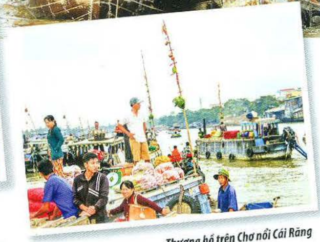
Thương hồ trên Chợ nổi Cái Răng

ít xung đột. “Buôn bán ở chợ nổi không ngã giá lâu, không cần ký giấy hợp đồng, kêu người làm chứng. Giao dịch tại chợ nổi chỉ trong vài mươi phút có thể “gật đầu” ngay dù đó là cả ghe dừa hầu hay hàng tấn khoai lang” - nhà nghiên cứu Nhâm Hùng nói.