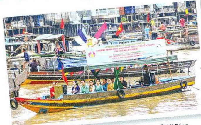
Biểu diễn đờn ca tài tử phục vụ du khách ở Chợ nổi Cái Răng.

Trải qua hơn trăm năm hình thành và phát triển, Chợ nổi Cái Răng đã định hình một nét văn hóa đặc trưng với cung cách buôn bán chân chất miền sông nước. Những cây bèo đung đưa phía xa xa: nào ổi, mận, vú sữa, chôm chôm, nào bắp cải, khoai lang, bầu bí... là những lời rao không thành tiếng nhưng thu hút vô cùng. Về với Chợ nổi Cái Răng, tôi gặp những khách