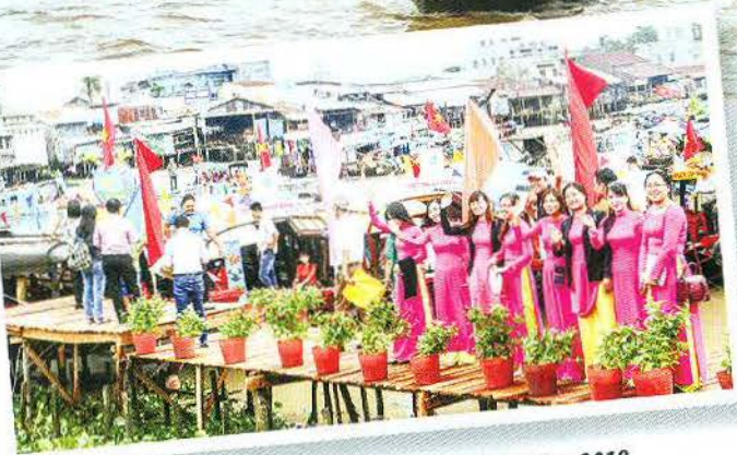
Rộn ràng Ngày hội Du lịch Chợ nổi Cái Răng 2018.