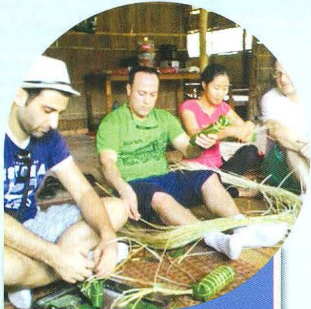
Du khách nước ngoài học gói bánh ở Homestay Út Hiên.