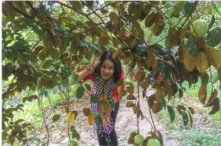
Du khách thăm miệt vườn trái cây.

Du lịch sinh thái gắn với các những khu du lịch sinh thái, điểm vườn cây trái như vườn du lịch Mỹ Khánh, vườn Ba Cống, Vàm Xáng, vườn lan Bình Thủy, trên các tuyến sông Phong Điền và nhiều vườn du lịch gia đình khác ở Ô Môn,