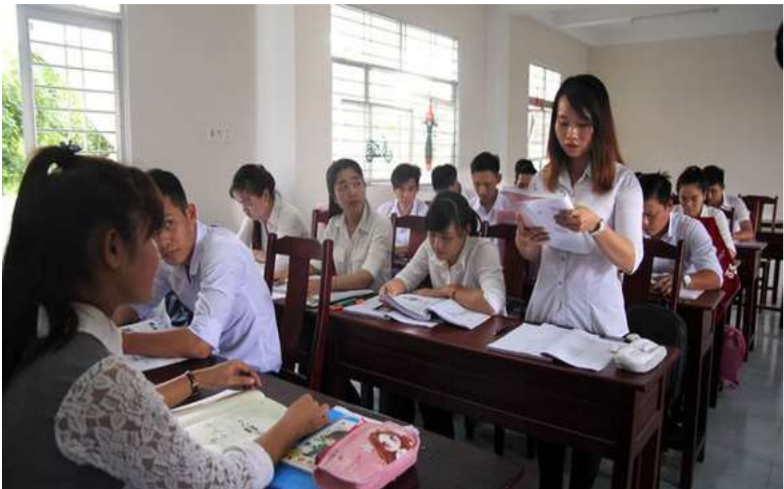
Các học viên học tiếng Nhật tại một trung tâm giáo dục thường xuyên tỉnh Bến Tre chờ cơ hội đi xuất khẩu lao động ở Nhật