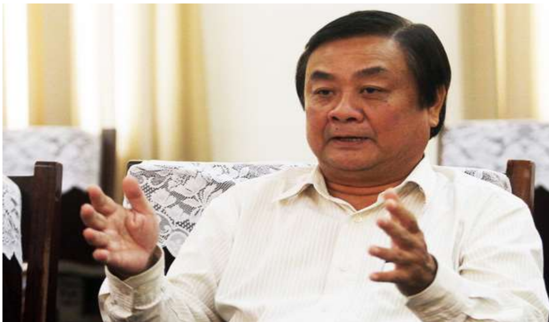
Ông Lê Minh Hoan, Ủy viên Trung ương Đảng, bí thư Tỉnh ủy Đồng Tháp

TTO - "Nguồn nhân lực hiện nay và trong tương lai cần tập trung phục vụ chuỗi ngành hàng gồm: công nghệ sinh học, công nghệ bảo quản chế biến, công nghệ thông tin, xây dựng thương hiệu..."