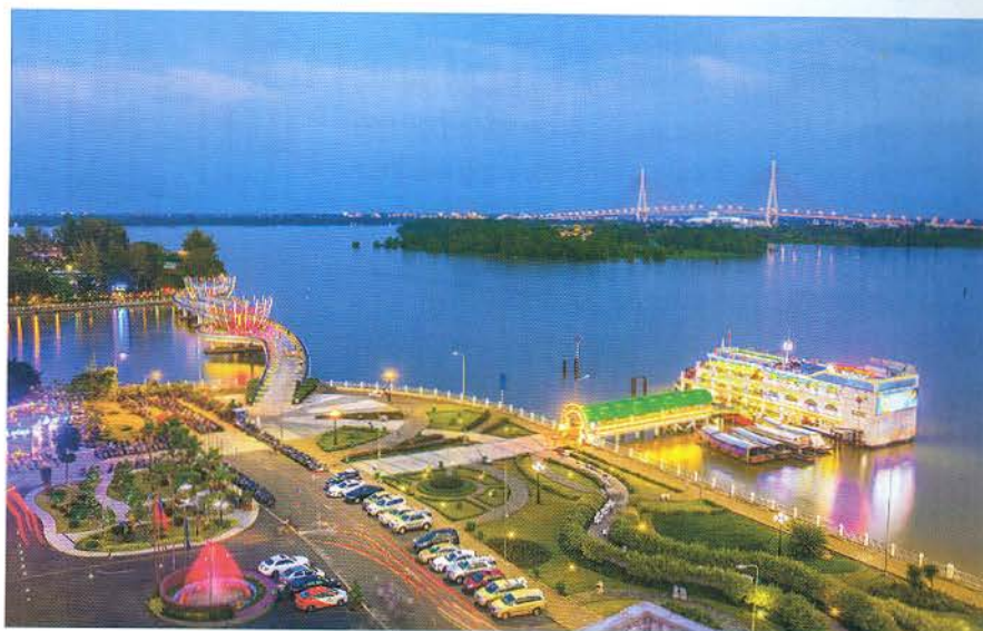
Bến Ninh Kiều.

Hội chợ Du lịch quốc tế Việt Nam - VITM Cần Thơ 2019 lần đầu tiên được tổ chức tại Trung tâm Xúc tiến Đầu tư Thương mại và Hội chợ triển lãm Cần Thơ, từ ngày 29/11 - 1/12/2019. Hội chợ có quy mô hơn 350 gian hàng của hàng trăm doanh nghiệp quốc tế và Việt Nam, các cơ sở dịch vụ và điểm du lịch cả nước. Đây là sự kiện du lịch có quy mô lớn nhất của khu vực ĐBSCL trong năm 2019, được tổ chức nhằm hỗ trợ các doanh nghiệp du lịch trong khu vực xây dựng, quảng bá, chào bán các sản phẩm; góp phần đưa du lịch thành ngành kinh tế mũi nhọn của khu vực. VITM Cần Thơ 2019 đặt mục tiêu sẽ trở thành một sự kiện du lịch tiêu biểu hàng năm của khu vực ĐBSCL. Điểm nhấn của hội chợ là Diễn đàn du lịch “Phát triển du lịch ĐBSCL” nhằm đưa ra các giải pháp phát triển du lịch khu vực ĐBSCL nói chung, phát triển du lịch Cần Thơ nói riêng.