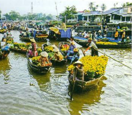
Văn hóa chợ nổi độc đáo.