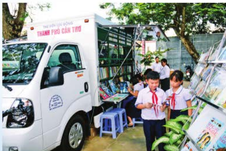
Độc giả nhí đọc sách tại "Xe Thư viện lưu động đa phương tiện" của Cần Thơ.

Kế hoạch yêu cầu Thủ trưởng các cơ quan, đơn vị, địa phương có liên quan tổ chức thực hiện với tinh thần trách nhiệm cao nhất. Trong quá trình thực hiện, nếu có khó khăn, vướng mắc, các đơn vị báo cáo kịp thời về Sở Văn hóa, Thể thao và Du lịch để tổng hợp, trình Ủy ban nhân dân thành phố xem xét, giải quyết theo quy định. Với kế hoạch này, thành phố Cần Thơ quyết tâm xây dựng văn hóa, con người Cần Thơ đáp ứng yêu cầu phát triển bền vững đất nước./.