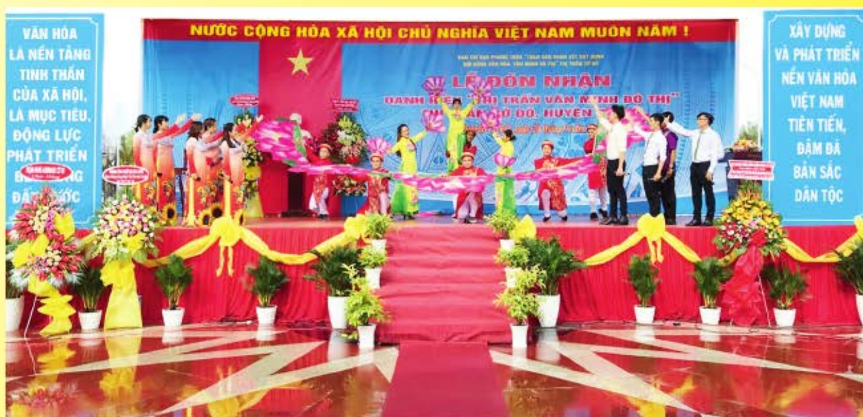
Chương trình văn nghệ chào mừng tại Lễ đón nhận danh hiệu "Thị trấn văn minh đô thị" thị trấn Cờ Đỏ, huyện Cờ Đỏ.