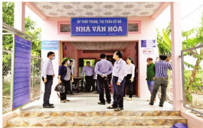
Văn phòng Thường trực Ban Chỉ đạo phụ trách Phong trào "Toàn dân đoàn kết xây dựng đời sống văn hóa" thành phố đến khảo sát, kiểm tra ấp Thới Trung, thị trấn Cờ Đỏ.

T ừ khi triển khai kế hoạch xây dựng thị trấn đạt danh hiệu "Thị trấn đạt chuẩn văn minh đô thị", Đảng bộ, Chính quyền và Nhân dân thị trấn Cờ Đỏ luôn nỗ lực phấn đấu, thực hiện thắng lợi các chỉ tiêu kinh tế, xã hội, quốc phòng, an ninh của địa phương. Theo báo cáo, 9/9 ấp của xã được công nhận ấp văn hóa nhiều năm liền. Ban Chỉ đạo xã đã xác định việc xây dựng gia đình văn hóa là cơ sở, là hạt nhân nòng cốt để