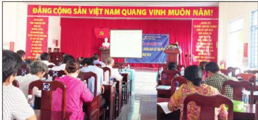
Lớp tập huấn nghiệp vụ Mô hình phòng, chống bạo lực gia đình tại thị trấn Vĩnh Thanh, huyện Vĩnh Thanh. Đến cuối năm 2019, 100% xã, phường, thị trấn đã được tập huấn và nhân rộng mô hình.

Từ thực trạng này, ngày 06 tháng 02 năm 2014, Thủ tướng Chính phủ ban hành Quyết định số 215/QĐ-TTg về phê duyệt "Chương trình