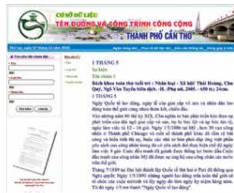
Một trang Cơ sở dữ liệu Ngân hàng tên đường và CTCC thành phố tại địa chỉ http://www.nganhangtenduong.cantho.gov.vn/ .

Qua hơn 10 năm thực hiện Đề án, cơ sở dữ liệu Ngân hàng tên đường và CTCC thành phố có tổng cộng 691 tên, gồm: 380 danh nhân, 144 danh nhân địa phương, 44 nhân vật lịch sử, 70 địa danh,