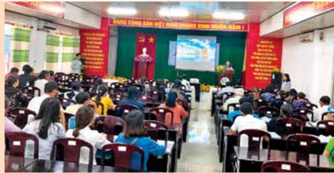
Lớp tập huấn Xây dựng đời sống văn hóa ở cơ sở và gia đình tại Hội trường Sở VH-TT-DL.

Công tác xây dựng đời sống văn hóa ở cơ sở và gia đình hiện nay được toàn xã hội quan tâm sâu sắc, các cấp, các ngành, các đoàn thể cùng góp sức củng cố và chung tay xây dựng. Vừa qua, Sở Văn hóa, Thể thao và Du lịch - Cơ quan Thường trực Ban Chỉ đạo các Chương trình mục tiêu quốc gia thành phố Cần Thơ giai đoạn 2016 - 2020, đã tổ chức thành công 02 lớp tập huấn nhằm trang bị kiến thức chuyên môn cơ bản và bồi dưỡng nghiệp vụ để triển khai thực hiện Phong trào “Toàn dân đoàn kết xây dựng đời sống văn hóa” và công tác gia đình, đặc biệt là việc triển khai hướng dẫn, sử dụng phần mềm “Cơ sở dữ liệu về văn hóa và gia đình” nhằm tăng cường ứng dụng công nghệ thông tin, trong công tác cải cách hành chính cho công chức, viên chức, người phụ trách công tác phong trào ở cơ sở.