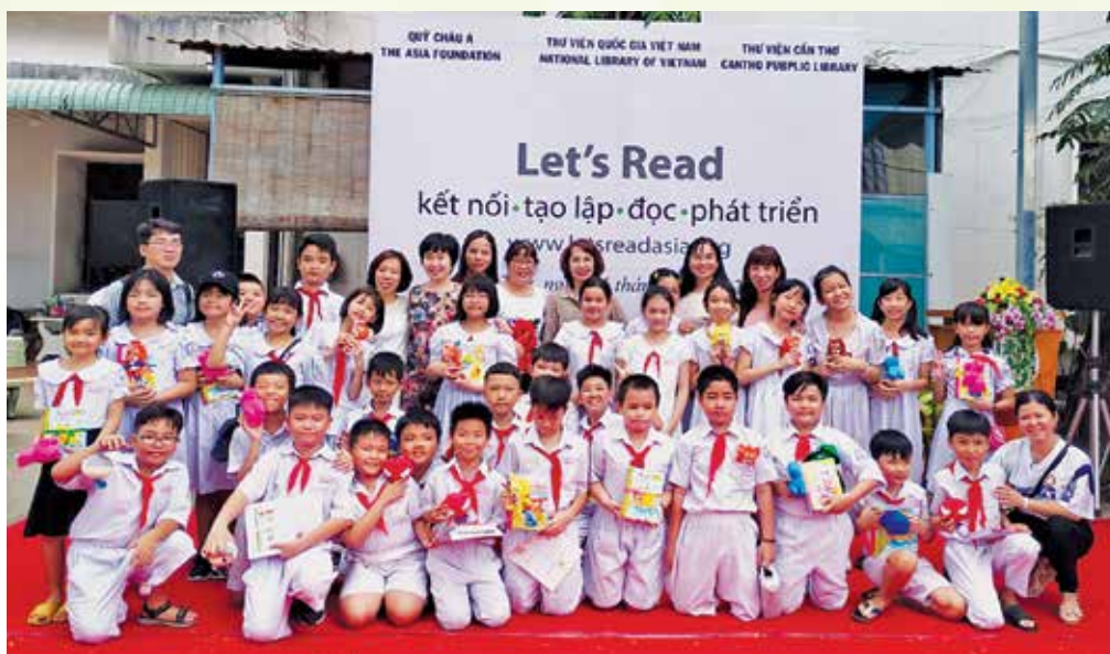
Bạn đọc thiếu nhi tham gia chương trình “Khám phá thư viện số Let's Read” tại Thư viện TP. Cần Thơ

Bên cạnh đó, các thư viện quận, huyện duy trì tốt tổ chức các hoạt động triển lãm, tuyên truyền, giới thiệu sách báo góp phần phục vụ nhiệm vụ chính trị nhân các ngày lễ, kỷ niệm lớn, các sự kiện tại địa phương: Ngày hội tòng quân, Hội thi tuyên truyền lưu động, Ngày hội Hoa phượng đỏ,... Đặc biệt, chú trọng tổ chức các hình thức phục vụ ngoài thư viện như: Kết hợp phục vụ sách báo tại các sự kiện, các hoạt động văn hóa – văn nghệ lưu động, phục vụ sách báo tại các trung tâm y tế, các điểm café sách và sinh hoạt cộng đồng nhằm nâng cao hiệu quả phục vụ sách báo cho người dân.