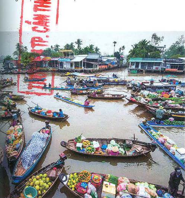
Chợ nổi Phong Điền là điểm đến thú vị đối với du khách.

Nâng cao nhận thức một cách đầy đủ và có trách nhiệm đối với cộng đồng là hết sức quan trọng để cộng đồng có thái độ ứng xử thân thiện. Trong đó, chú trọng nâng cao nhận thức của cộng đồng về trách nhiệm bảo vệ các giá trị tự nhiên, văn hóa bản địa để đảm bảo cuộc sống của họ với những thu nhập họ có được qua việc tham gia vào hoạt động phát triển du lịch trên cơ sở khai thác những giá trị sông nước miệt vườn.