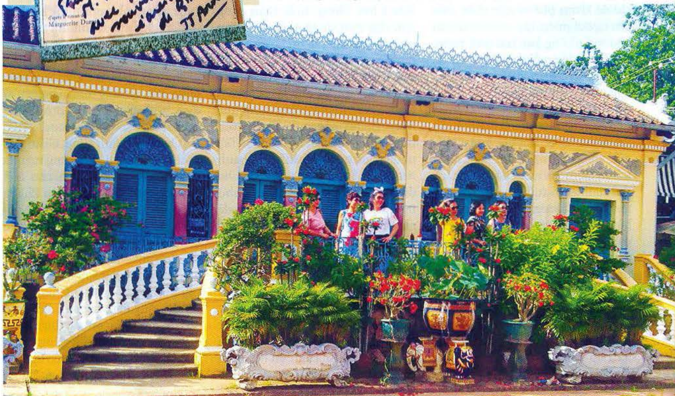
Du khách chụp ảnh lưu niệm tại căn nhà cổ xưa.

Nhà thờ họ Dương tọa lạc trên một thửa đất rộng khoảng 6.000m 2 theo hướng Đông-Tây. Trước mặt là đường giao thông và sông rạch