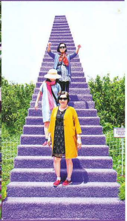
Căn nhà màu tím “đốn tim” du khách.