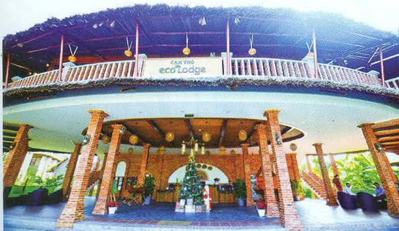
Khu du lịch Căn Thơ Ecolodge.

Một khu nghỉ dưỡng khác sang trọng nhưng cũng rất bản sắc là Căn Thơ Ecolodge, thuộc phường Ba