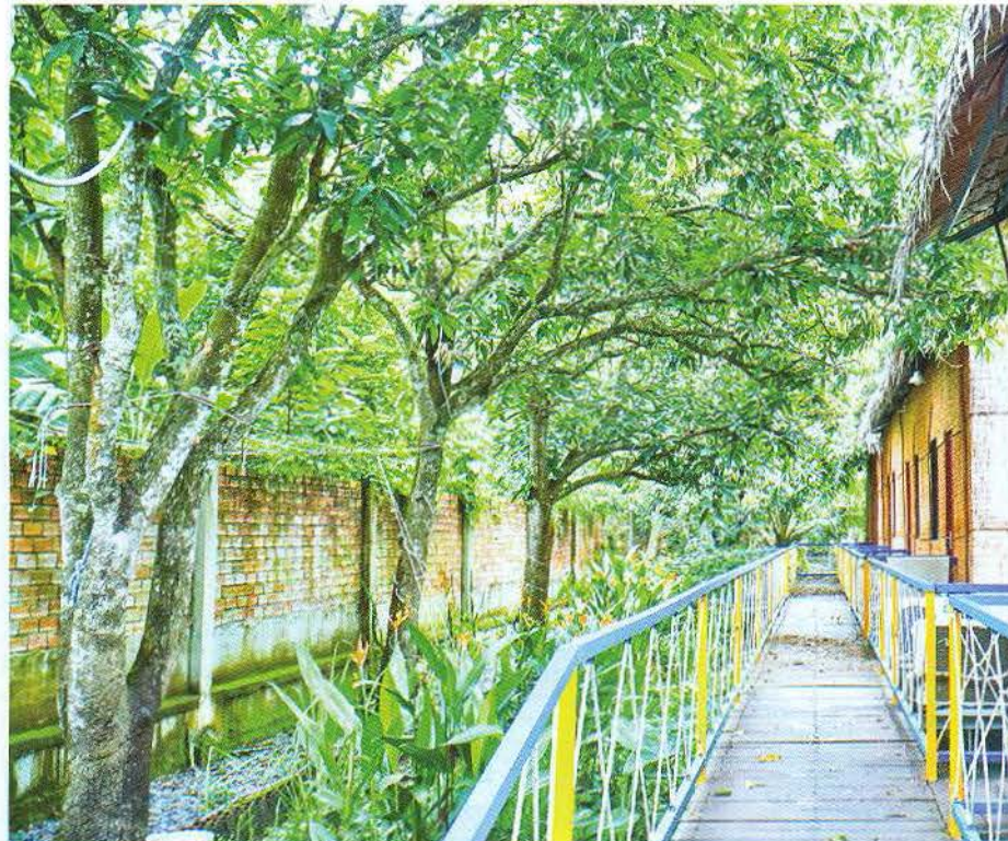
Homestay mái lá giữa hàng xoài xanh mát trong lòng phố của anh Phạm Hải Việt. Ảnh: DUY KHÔI

* * * Du lịch được xem là ngành kinh tế có tốc độ phát triển rất nhanh hiện nay của Cái Răng, với mô hình du lịch thành công đó là bản sắc và sinh thái. Những thuật ngữ “du lịch